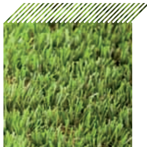
Ref. 31 - Beije