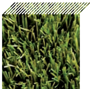
Ref. - Barcelona