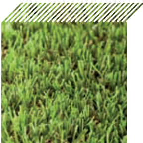
Ref. 30 - Castanho