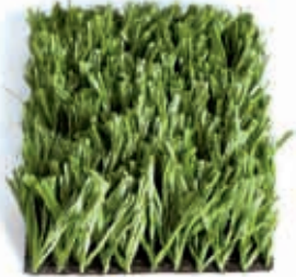
Pré-Fibrilado, 11.000 dtex