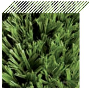
Ref. - Viseu