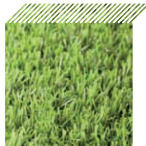
Ref. 40 - Verde