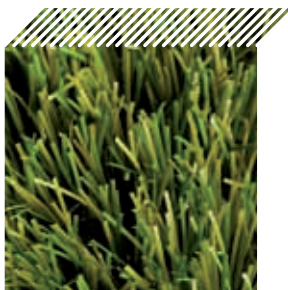
Ref. - Ovar