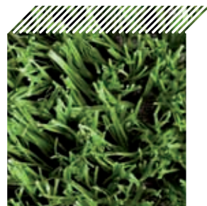
Ref. - Porto

UK Safina, the only producer of artificial turf in Portugal, has been optimizing and diversifying its product range to better meet their customer needs.