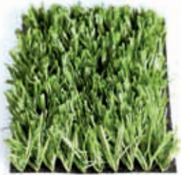
Fibrilado, 8.800 dtex